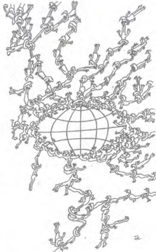
F. D. 20

Büyük bir hızla genişlemekte olan İNTERNET, gerek kitle iletişim araçları aracılığı ile, gerekse genel eğitim programları tarafından desteklenerek, tüm bireylerin hizmetine sunulmalıdır.