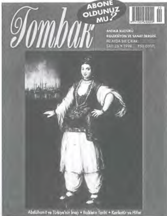
Abdülhamit ve Türkiye'nin İmajı • Bizlerin Tarih • Kerkatir ve Hiler